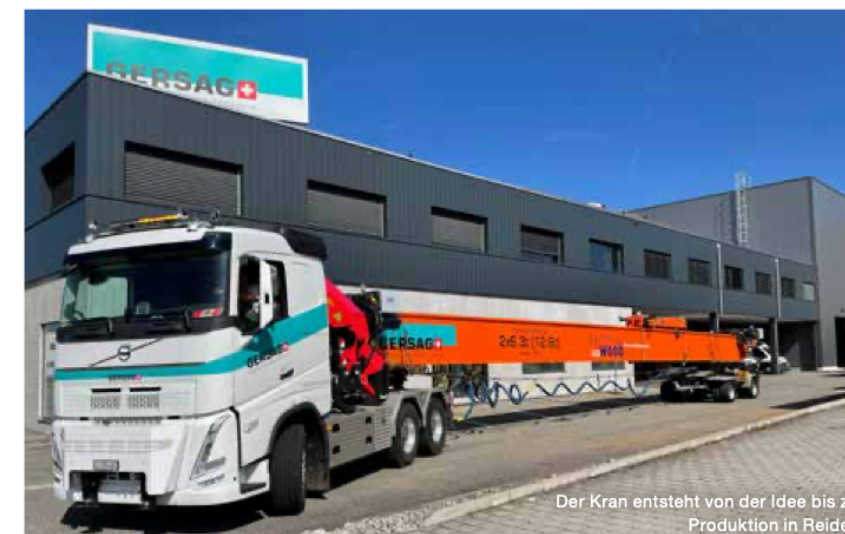
Der Kran entsteht von der Idee bis zur Produktion in Reiden.