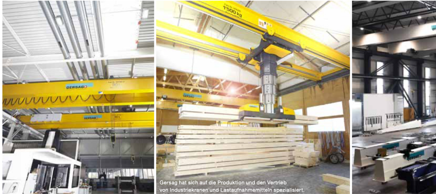
Gersag hat sich auf die Produktion und den Vertrieb von Industriekranen und Lastaufnahmemitteln spezialisiert.